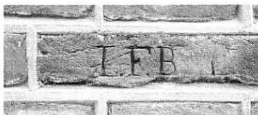
In de achtergevel van het huis hebben verschillende generaties Beijen hun initialen gekerft. Hier één de duidelijkste.

Op de kadastrale stadsplattegrond van 1832 met benoeming van de grondeigenaren krijgen we een beeld van de oppervlakte van het huis met tuin en bijgebouwen op de schaal van de overige bebouwing. De tuin (nr. 94) was enorm, veruit de grootste in de binnenstad, en besloeg maar liefst bijna 2000 m 2 ! Op de kaart is het huis Benschopperstraat 25 te vinden onder nummer 93. De bebouwing is nog ingetekend tot aan de straat, dus inclusief voorhuis. Tot de eigendommen van Johan Franco-3 behoorde in 1832 ook de nummers 95,96,99 en 100 waarbij nr. 99 als schuur is gekenmerkt. De andere nummers staan aangegeven als woonhuizen en stalling.